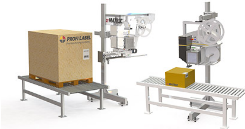
Abb. 3: Der eMATRIX ® S7000 von Profi Label kann dank integrierter Kipp- und Drehfunktion easyRotation ® in jeder Lage (zum Beispiel Seiten- und Überecketikettierung) etikettieren. Das leistungsstarke Kennzeichnungssystem ist seit September 2016 mit weiteren Sensoren zur proaktiven Prozesssteuerung ausgestattet.