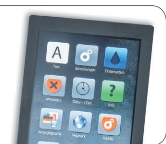
Echtzeit-Zugriff auf das Gerät per Remote-Screen