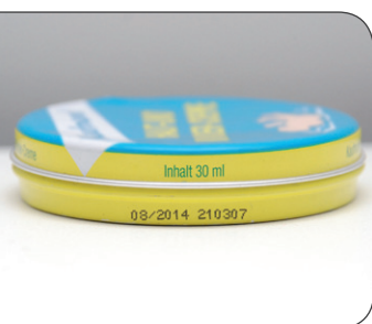
Flexibilität durch variable Direktbeschriftung.

Der Druckkopf lässt sich leicht reinigen und die nachfüllbaren Vorratsbehälter sind direkt zugänglich, so dass der Tinten- und Lösemittelwechsel blitzschnell vollzogen wird.